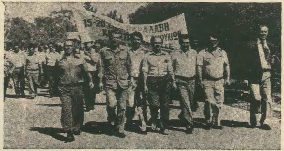
Από πορεία εκπροσώπων των άμπελουργών προς τὸ Προεδρικό Μέγαρο.

Το πρόβλημα της διάθεσης και οι εξεφετελιστικές τιμές, πούλησης (με την ύπαρξη και κερδοσκοπία του παρασιτικού κλάδου των μεσαζόντων-χοντρεμπόρων) θα συνεχίσει ως τη δημιουργία Συμβουλίου Εμπορίας Φρούτων καθώς και την οργανωμένη διεκδίκηση των δικαίων αιτημάτων από μέρους όλων των φρούτοπαραγωγών. Μόνο έτσι θα δημιουργηθούν προϋποθέσεις τέτοιες που, σταδιακά, θα μπορέσουν να λυθούν (στο βαθμό βέβαια, που θα εξαρτιέται η λύση από τα πιο πάνω μέτρα) αυτές οι πιυχές του προβλήματος. Συνάμα δεν παραγνωρίζουμε πως το πρόβλημα συνδέεται άμεσα και με τη γενικότερη Κυβερνητική πολιτική.